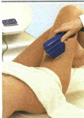
Anti-cellulite Alcuni apparecchi laser del gruppo El.En. per il restauro (a sinistra) e l'estetica

Cangioli. Nel primo trimestre 2012 il fatturato consolidato ha superato i 60 milioni di euro, con un incremento del 32,9% rispetto all'anno prima, mentre l'ebitda è stato di 4,4 milioni di euro e l'ebit di 1,8 milioni.